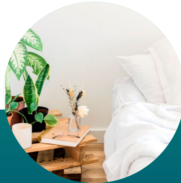
COLCHONES Y HABITACIÓN