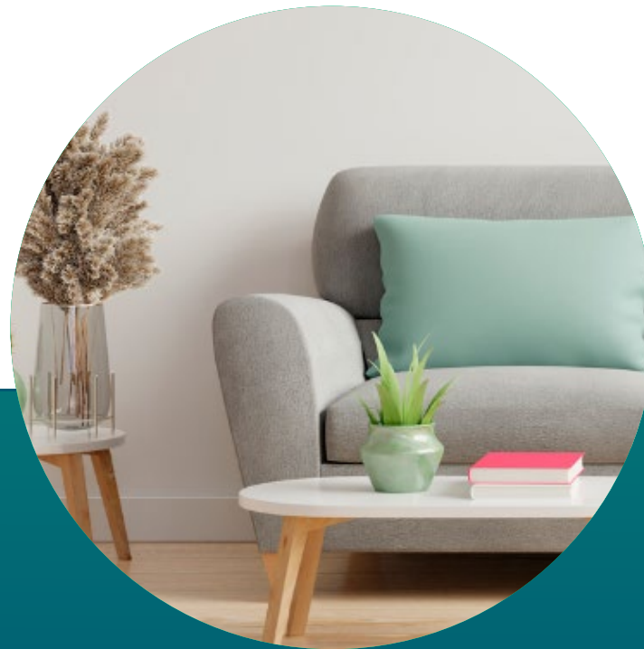
MUEBLES DE INTERIOR