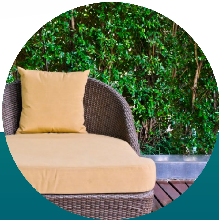
GARTEN MOEBEL AUSSENBEREICH

eine Eigenschaft, die besonders bei Matratzenbezügen und Möbeln für den Innen- und Außenbereich geschätzt wird. Die besondere Atmungsaktivität macht das Produkt auch zum perfekten Material für Sportbekleidung, da es die Feuchtigkeit des Körperschweißes kontrolliert, während der Stoff trocken und die Körpertemperatur konstant bleibt..