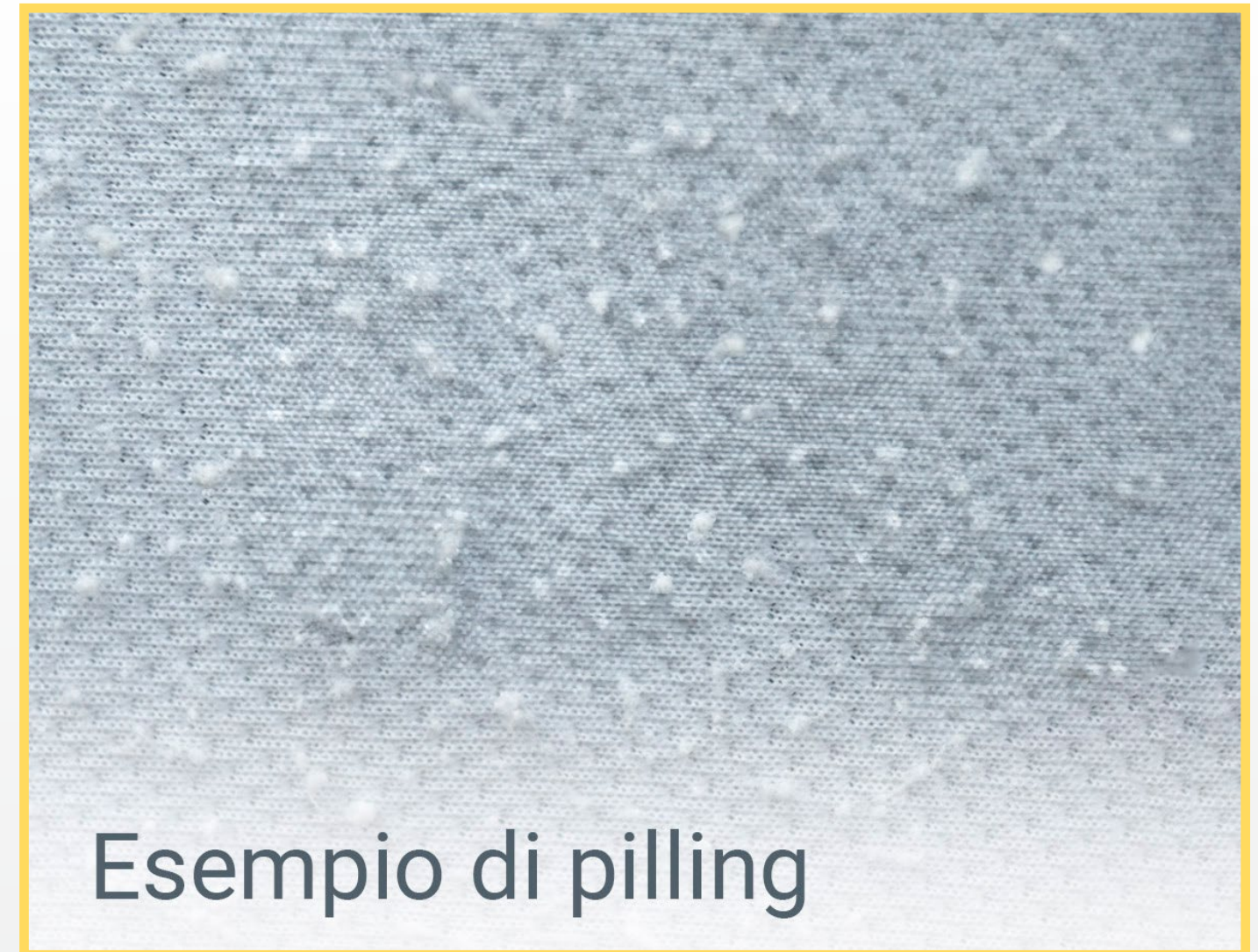
Esempio di pilling

Il tessuto PILLFREE mira a risolvere questo problema comune e a prolungare la vita e l'estetica di prodotti come materassi, topper e cuscini.